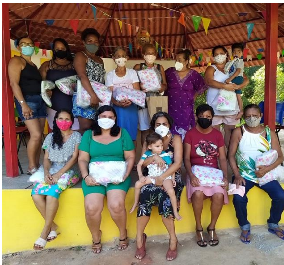
De dames van de gaarkeuken blij met de set lakens en slopen