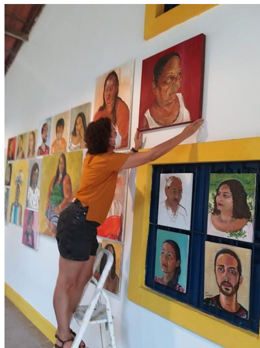
Een wand vol portretten

Ik bewonder vooral de vrouwen hier in de wijk die van alles uitvinden om te overleven. Zo ook de trouwe inzet voor de gaarkeuken, Eind vorig jaar hebben we met de groep cursisten van de schilderles hier in het atelier de medewerkers van de Cozinha Afetiva geportretteerd. Een eerbetoon aan hen.