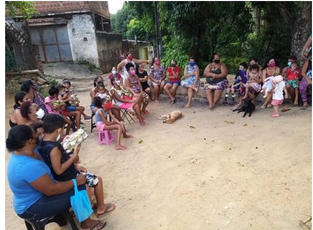
Het Kerstfeestje bij ons om de hoek

Begin januari hebben we in de twee wijkjes die bij ons in de buurt gedurende de laatste 15 jaar ontstaan zijn, een soort kerstfeest gehouden met de vrouwen die gebruik maken van de gaarkeuken.