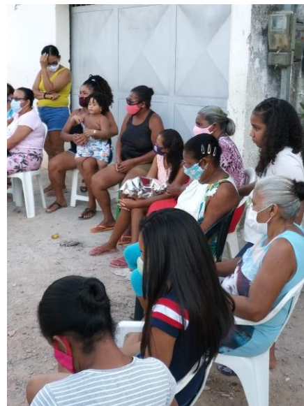
Nog een foto van het Kerstfeest met de vrouwen in de wijk