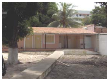
Het pad naar de computerruimtes, zodat iedereen droge voeten houdt

leerling een baan heeft gekregen bij een ingenieursbureau, en vijf leerlingen voor zichzelf begonnen zijn. Zo heeft een leerlinge, die zwanger was, haar hele babyuitzet (wieg, badje, commodekast,..) zelf kunnen betalen met haar eigen verdiende geld.