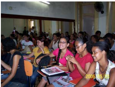
Plezier in Het Grote Huis

In februari 2006 zijn wij in het Grote Huis van start gegaan met een cursus onderhoud van microcomputers, die inmiddels in september is afgesloten. PROGEPE heet de cursus heel chique: "Programa de Geração de Emprego e Renda pela Educação". De bedoeling was een beroepsvorming en een mogelijkheid tot eigen inkomen te bieden aan jongeren uit arme wijken die in een kwetsbare sociale situatie verkeren en die openbaar onderwijs volgen of gevolgd hebben. Opzet, uitvoering en nu de afsluiting door middel van stagebegeleiding waren en zijn nog steeds voor ons een experiment dat succesvol is.