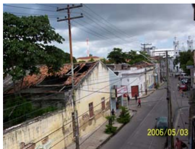
Blik op de straat vanuit het Grote huis

Op de vrijdagochtend was er technisch Engels, d.w.z. Engels speciaal gericht op de "computertaal". Dit verliep evenwel wat stroef omdat basiskennis van het Engels bijna volledig ontbrak. Daarom zijn we vanaf het meest elementaire begin moeten starten. Ook was er ruimte voor eigen inbreng van de cursisten, evaluatie en persoonlijke gesprekken met de leiding.