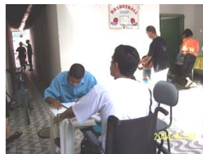
In het gehandicaptenproject

Wij willen in Mangueira drie computers installeren. Dan kunnen wij ook daar cursussen geven en mensen met een beperking vertrouwd maken met informatica. Toegang tot internet zal ook echt hun horizon verbreden, hetgeen voor hen natuurlijk fantastisch is aangezien zij vanwege hun beperking nauwelijks hun huis uitkomen. Verder hopen wij zo ook enkele mensen met een beperking voor te bereiden om deel te nemen aan de cursus onderhoud van microcomputers in het Grote Huis. Dat zou dan een beroepsmatige vorming betekenen en vooral ook inkomen, d.w.z. enige autonomie! Dat zijn plannen voor 2007 waaraan wij gaan werken en waarvan Wilde Ganzen al heeft gezegd op 7 oktober: daar doen wij aan mee!