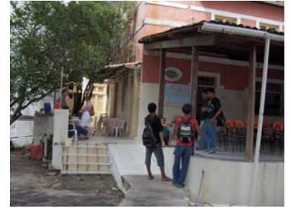
Stukje van de tuin

met juridische en bedrijfskundige thema's: arbeidsrecht, recht van de consument, inleiding in boekhouding, inzicht in management en bestuur. Ook het opstellen van een curriculum vitae en sollicitatietraining zijn aan de orde geweest.