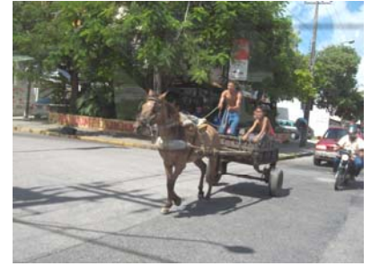
Dagelijks gezicht in Recife