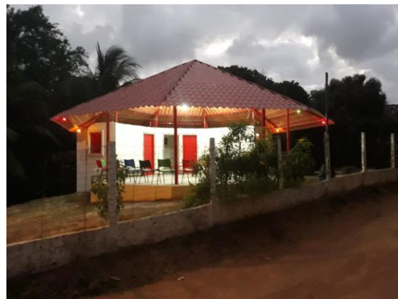
De prachtige Eco-Oca in de avond

De structuur is lichter en het ziet er prachtig uit. Ontbreekt enkel nog de hydraulische installatie.