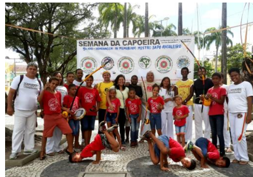
Uitje naar Oud-Recife van de capoeira groep bij gelegenheid van de Dag van de Capoeira