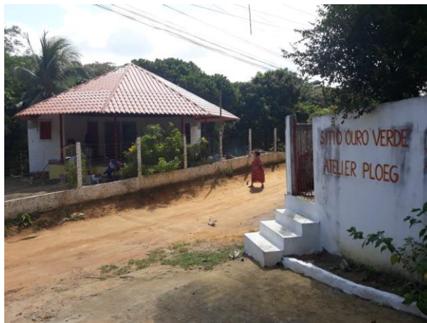
Nog een mooi beeld van de Eco-Oca met rechts de ingang naar de Sitio Ouro Verde