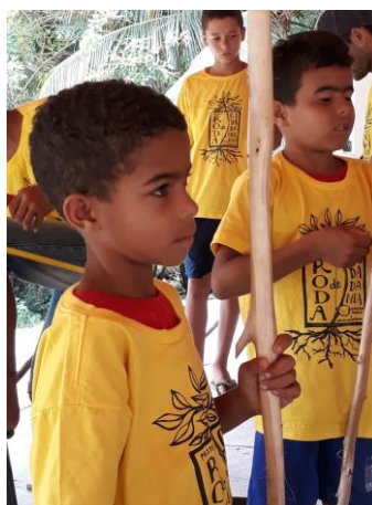
Mooi en met volle aandacht