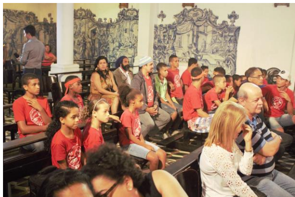
20 juli (foto boven en beneden): voor velen de eerste keer naar een klassiek concert in de oude kerk van Olinda, voor het eerst in het oude centrum van Olinda en voor het eerst in zo'n historische kerk. Heel mooi