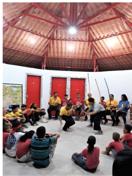
Viering van twee jaar capoeira in de nieuwe Eco-Oca

We gebruiken de eco-oca al volop. Voor de capoeira en voor bijeenkomsten met de lokale gemeenschap.